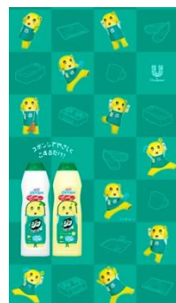
オリジナル壁紙（スマートフォン用）