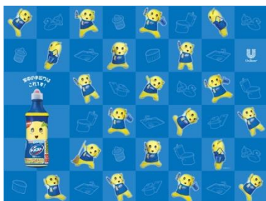
オリジナル壁紙（PC用）

【キャンペーンページ URL】 http://www.domesto.jp/special/funassyi/