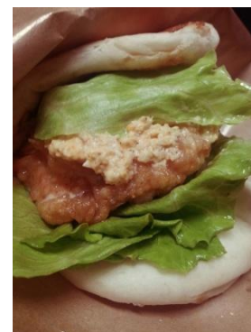
<チキン南蛮ナンサンド >