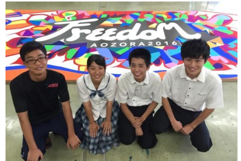
＜宮崎日大高校芸術学科の皆さん＞