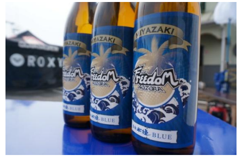
＜爽やかな口当たりが特徴の木挽 BLUE＞

また、「日向木挽 BLUE」はFREEDOMオリジナルボトルを製作し、九州会場にて販売します。また会場では、木挽とFREEDOMのコラボレーションステッカーも手に入れることができます。