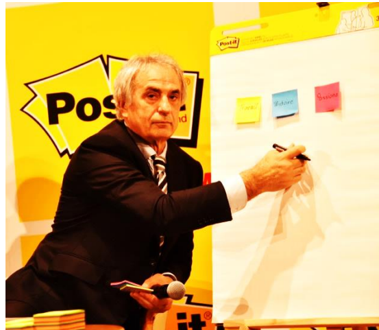
アンバサダー就任：ハリルホジッチ氏、文具・オフィス事業部 事業部長 広瀬由香里

ポスト・イット® 製品は世界 200 カ国で販売しており、オフィスや学校、家庭にて色々なシーンで愛用されています。ポスト・イット® ブランドは、ハリルホジッチ氏がサッカー指導の場で、ポスト・イット® イーゼルパッドを愛用していることから、このたびポスト・イット® ブランドのアンバサダーとして迎える運びとなりました。