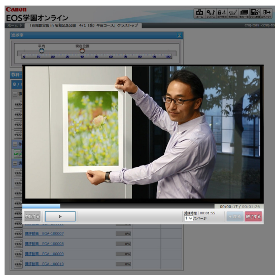
EOS 学園オンライン イメージ

「EOS 学園オンライン」は、東京、名古屋、大阪で好評の写真教室「EOS 学園」で蓄積してきた講座開催ノウハウを生かした新たなオンラインサービスです。通常の講座に参加することが難しいお客様でも、インターネットの環境さえあればいつでもどこにいても楽しく学ぶことができます。