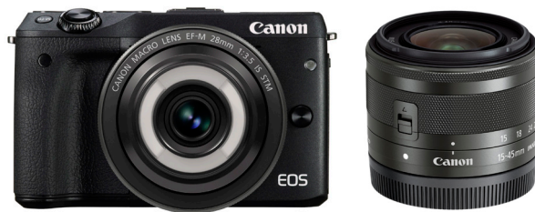
EOS M3・クリエイティブマクロ ダブルレンズキット(ブラック)

* レンズ交換式カメラ(一眼レフカメラ・ミラーレスカメラ)用オートフォーカス交換レンズとして。2016年5月11日時点。キャノン調べ。