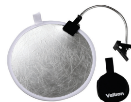
ベルボン レフ板&クリップセット II

「EOS M3 / EOS M10・クリエイティブマクロキット」に関するキャンペーン URL canon.jp/macrokkit