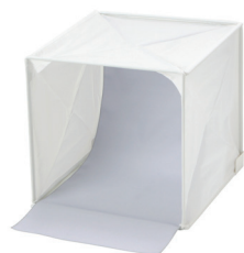
ハクバ デジカメスタジオボックス 30