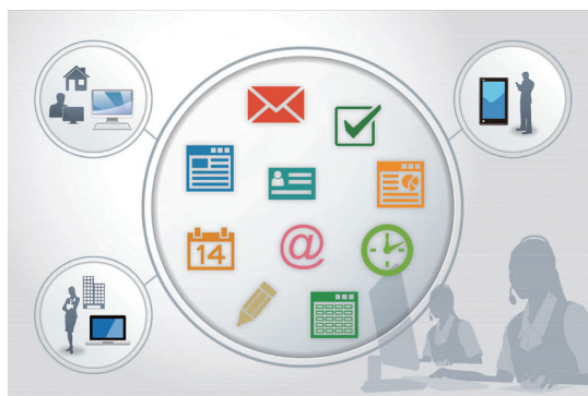
「HOME type-O, Powered by Office 365」イメージ図

キャノンマーケティングジャパン株式会社(代表取締役社長：坂田正弘、以下キャノン MJ)は、中小オフィス向け IT 支援サービス“HOME(ホーム)”のサービスとして、オフィススイートサービス「HOME type-O, Powered by Office 365」を8月30日より提供します。キャノン MJ グループは、IT 管理者が不在の中小オフィスでも短期間で「Office 365」の導入、運用を可能にし、今後“HOME”を中心にクラウドビジネスを強化することで中小オフィスの生産性向上と売上拡大を支援していきます。