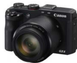
PowerShot G3 X

※デコウォールフォトは、お気に入りの写真をキャンバス地に直接プリントして届ける withPhoto のサービスです。