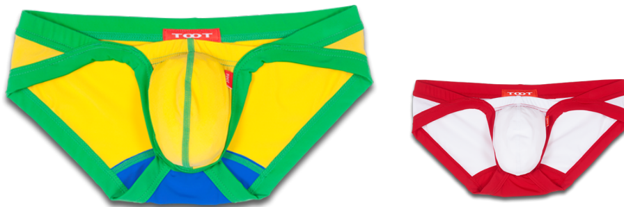
TOOT2016FWコレクション「カラーバインダービキニ」 左：イエロー×グリーン 右：ホワイト×レッド／価格：価格:3,672円／サイズ：S,M,L,XL／上記のを含む4色を展開

株式会社TOOT(トゥート:東京都港区 代表取締役社長 柗野恵也、以下TOOT http://www.toot.jp )は7月22日(金)よりTOOTのオフィシャルWEBストア並びに、伊勢丹新宿店メンズ館、JR名古屋高島屋、阪急メンズ大阪等にて2016FWコレクションの皮切りとして新デザイン「カラーバインダービキニ」を発売します。