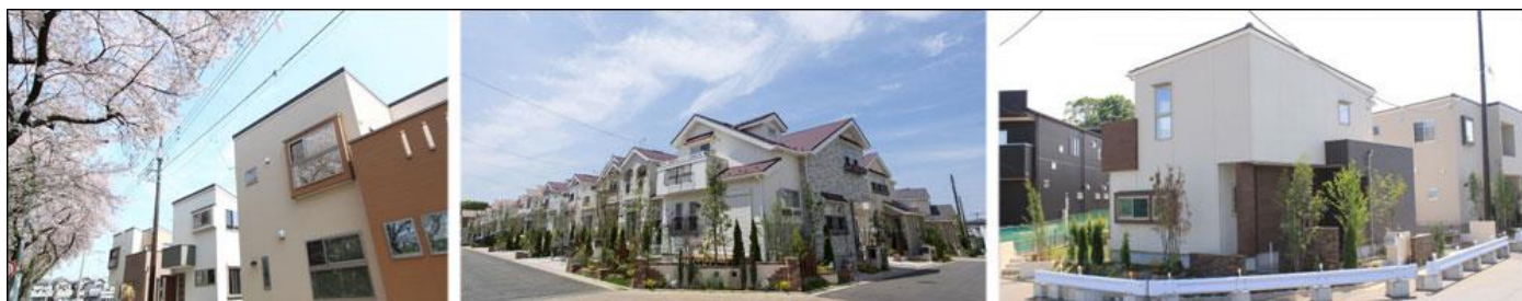
【掲載物件例】 左:戸田コーストスタイル 中:リーズン船橋・高根台 右:柏の葉PRIME(プライム)

住宅購入の理由はさまざまですが、ライフスタイルの変化に合わせて購入する方も多く、「子供の誕生や成長等に備えるため」という方も多いられています。子どもの成長に合わせたより広い間取り、将来にそなえて充実した教育施設、緑に囲まれた安心できる環境など、のびのびと子育てするためには、住環境に求めるさまざまな条件が出てきます。本特集では、子育てがしやすい住環境という視点から、住宅選びの4つのポイントを基に物件をピックアップしています。