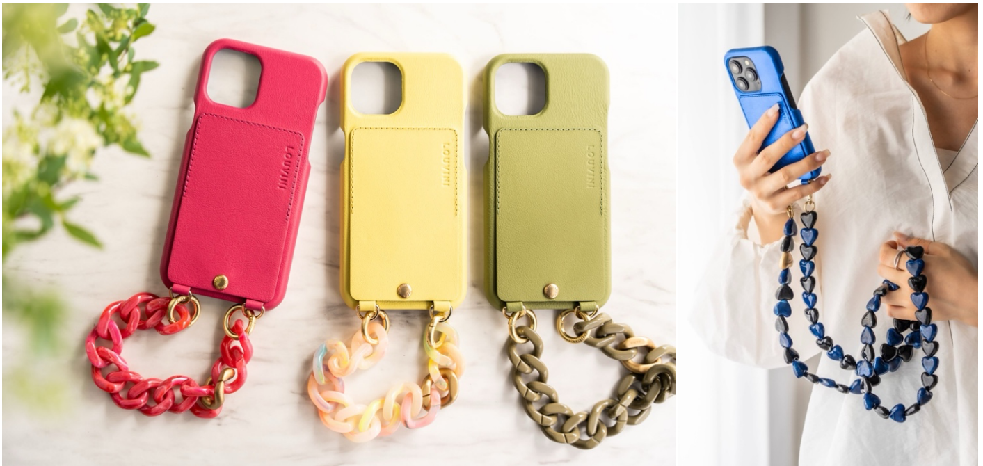
『Louvini Paris』のケース「LOU」シリーズと、ストラップ「ZOE」（写真左）「CUORE」（写真右）シリーズ

オンラインストア： https://rdeco.store/collections/louvini