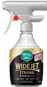
『リセッシュ除菌EX WIDE JET STRONG (ワイドジェットストロング)』