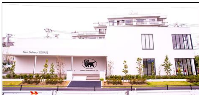
【ネクストデリバリースクエア外観】