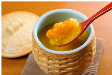
「かぼちゃの茶碗蒸し」 価格:594円(税込) シーサイドモール5F 築地玉寿司

館内の12店舗で、ハロウィン限定メニューを展開します。インドの甘い手作りアイスクリームと、どこか懐かしく温かいかぼちゃのお菓子のコンビネーション「甘くてしあわせインドのよくばりスイーツ(カザーナ)」や、しょうゆ風味のあんかけがかぼちゃの甘味をひきたてる「かぼちゃの茶碗蒸し(築地玉寿司)」などが登場します。