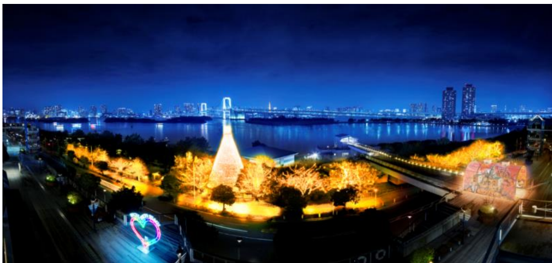
「樹木イルミネーション」イメージ

生木としては都内最大級の「台場メモリアルツリー」を中心にした全長約200mに渡る「樹木イルミネーション」では、期間中は約22万球の光がオレンジ色に輝いてハロウィンの雰囲気盛り上げます。人の動きを感知し映像に反映する屋外体感型イルミネーション「ILLUSION DOME(イリュージョンドーム)」内では、投影された映像に触れると、ハロウィンの象徴であるカボチャがランダムに回ったり、魔女がコミカルに踊りだしたりするギミック(仕掛け)を体験できます(9月29日(金)から開催)。ギミックはかわいらしい動きのため、お子さまも一緒に楽しむことができます。