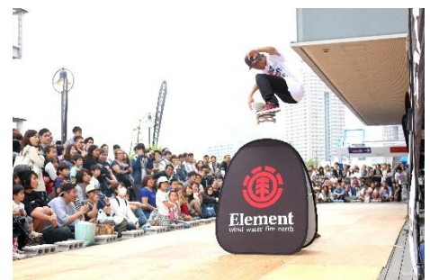
スケートボードショーの様子(イメージ)