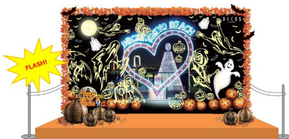
「ハロウィンおばけフォトスポット」イメージ

◆場 所: シーサイドモール3F デックス広場 シーサイドモール4F タワー広場