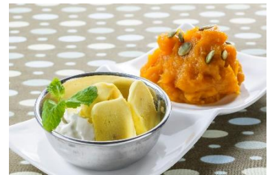
「甘くてしあわせ インドのよくばりスイーツ」 価格:650円(税込) シーサイドモール5F カザーナ