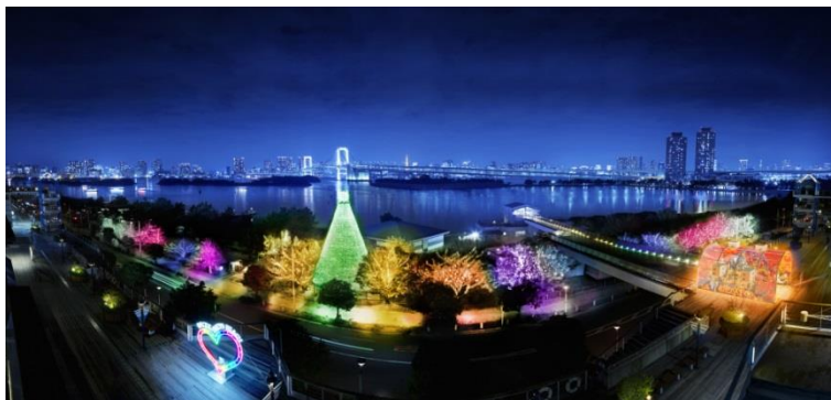
映画『レゴ®ニンジャゴー ザ・ムービー』とコラボレーションした期間限定演出イメージ

東京湾の美しい夜景と共に楽しめるデックス東京ビーチならではのイルミネーションで、印象的なハロウィンをお楽しみください。