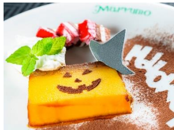
「かぼちゃのプリン」 価格:540円(税込) シーサイドモール5F トラットリア マルーモ