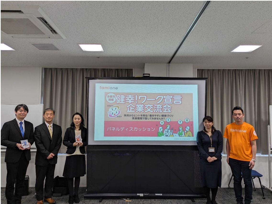
※パネルディスカッションに登壇の皆さまと