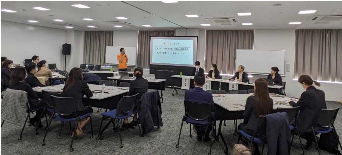
※ファミワン石川の講演