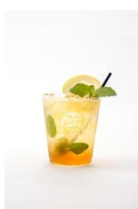
MINT LEMONADE × Hard Cidre