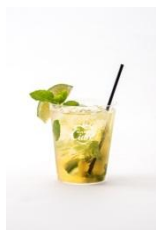
MOJITO × Hard Cidre