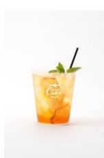
APPLE VINEGER × Hard Cidre