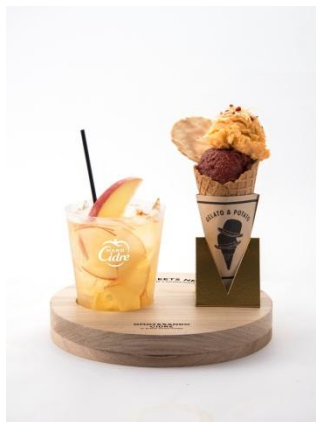
KIRIN Hard Cidre COCKTAIL × GELATO & POTATO セット