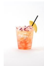
ROSE & HIBISCUS × Hard Cidre