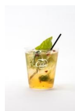
BASIL & PINK PEPPER × Hard Cidre