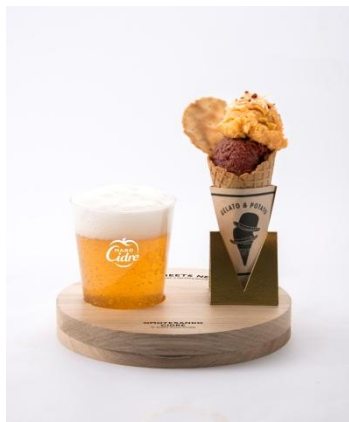
KIRIN Hard Cidre × GELATO & POTATO セット