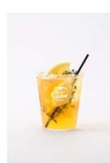
GRAPEFRUITS & THYME × Hard Cidre