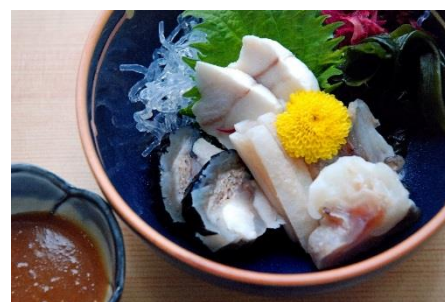
絶品！「あんこうの供酢」