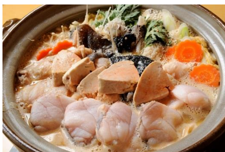
大洗冬の名物「あんこう鍋」

茨城県・大洗町観光情報サイト「よかつぱ 大洗」 URL http://www.oarai-info.jp/top.htm