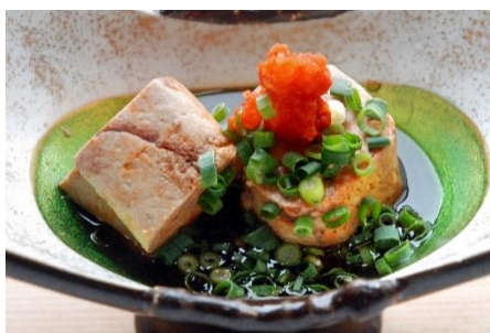
旨味が凝縮している「あん肝」