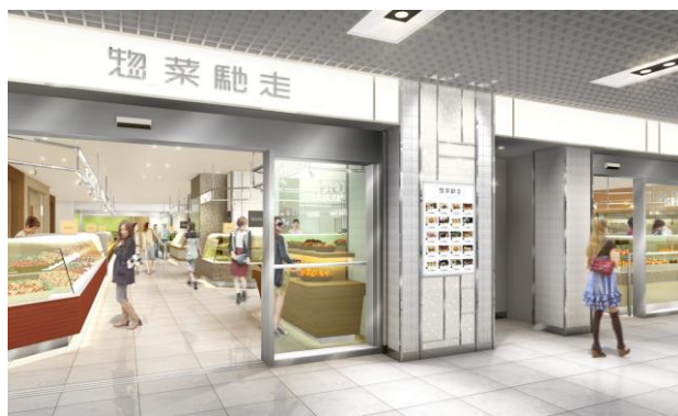
『DELICHIKA』専門区画『惣菜馳走』（イメージ）

各区画では、鮮度にこだわった四季折々の旬な食材やオーガニックフードも充実させました。また、“プチリッチグルメ”メニューや小分け惣菜の提供、気軽に立ち寄れるイトインコーナー設置など、食を楽しむすべての方々の利便性にもこだわりました。