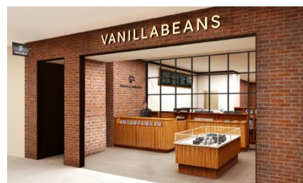
大人気のチョコレート専門店『バニラビーンズ』

“デリシャスな地下”という意味で名づけた『DELICHIKA(デリチカ)』では、全60店の名店・人気店が軒を連ねます。