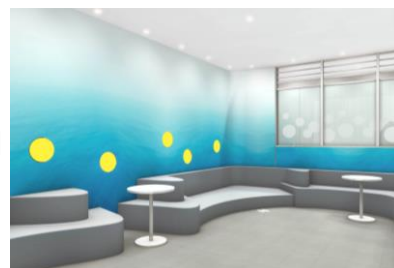
『ベビールーム』(イメージ)

「DELICHKA(デリチカ)」内には、お母さんと赤ちゃんがホッとできる『ベビールーム』を設置。川崎に馴染み深い多摩川と海をイメージしたアゼリアならではのやさしい空間を演出しました。授乳室2部屋とお着替え用ベッド4つを設置しています。