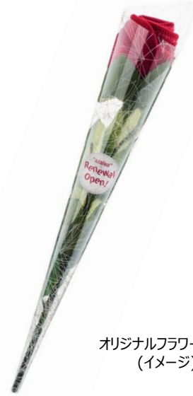
オリジナルフラワータオル (イメージ)