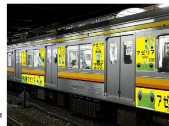
JR南武線車体広告(イメージ)