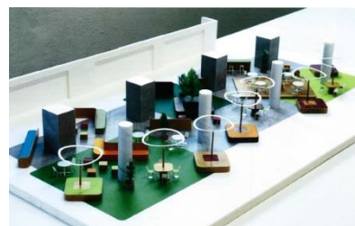
お休み処『ハミングガーデン』(イメージ)

サンライト広場の奥には、来場者の憩いの場としてお休み処『ハミングガーデン』を新設。サンライト広場同様、目にも心にも優しいグリーンカラーを基調に、柔らかな印象の曲線を使ったベンチ50席等を配しています。