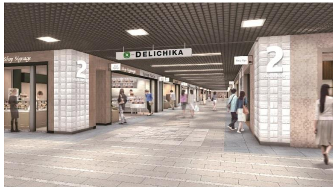
川崎アゼリア第1期リニューアルオープン区画『DELICHIKA(デリチカ)』（イメージ）