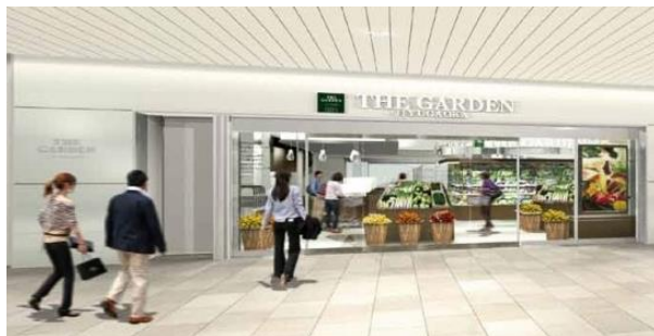
『DELICHIKA』内最大の売場面積『ザ・ガーデン自由が丘』