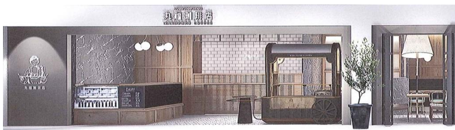
創業80年の老舗珈琲店『丸福珈琲店』