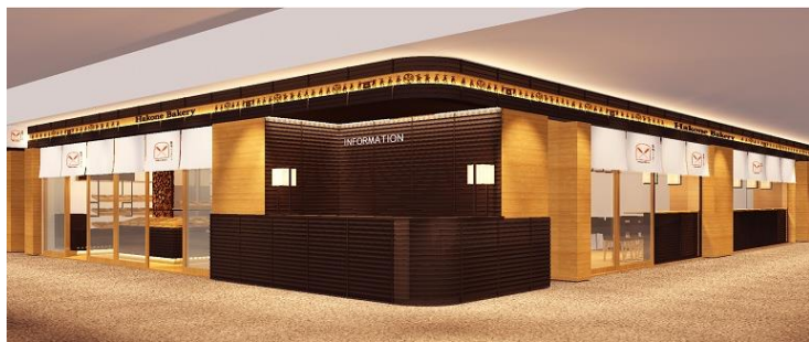
川崎アゼリアの“総合インフォメーション”と一体化した『箱根ベーカリー』

江戸に最も近い宿場町・商業街として栄えた「川崎」ならではの伝統的なモチーフや装飾を凝らした上質な店舗デザインなど、空間からサービスに至るまで「上質」をキーワードに、老若男女を問わず何度でも足を運びたいくなるゾーンづくりにこだわりました。いつもの食卓をちょっといい感じに。厳選された旬な食材や、バラエティあふれる特選銘菓の数々など、毎日の暮らしを彩る食物販ゾーン、それが『DELICHIKA(デリチカ)』です。