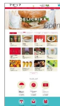
本サイト(7/31～) (イメージ)