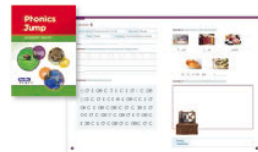
■レッスン復習教材

5レッスン毎の復習レッスンと、各レッスン毎の復習用教材(テキストとCD)でご自宅でもしっかりと復習できるので、学習内容の定着をサポートします。