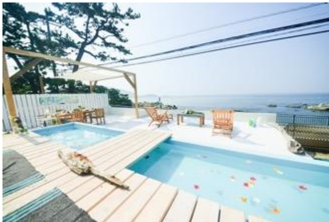
施設全景（ダイニング、テラス、ブループールなど）