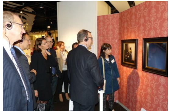
ナレッジキャピタル「The Lab.」を視察される御一行団

海外の各機関との連携構築による「国際交流」の実現を目指すナレッジキャピタルは、フランスで2番目の経済主要都市であるリヨン市と開業前から交流を深めてきました。