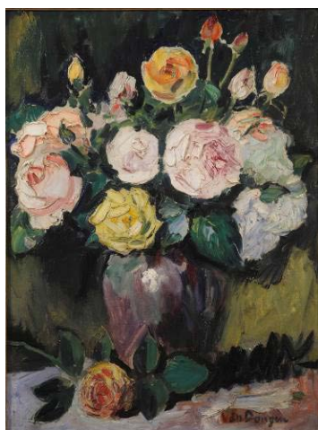
《薔薇のブーケ》 61×46 cm

今展では、華やかな社交界の肖像画、パリ、ヴェニス、エジプトなどの風景画、そして画家が愛した花々など約40点をご紹介します。ヴァン・ドンゲンは自らの作品について多くを語らず、人々の想像力にその解釈を委ねました。皆様にとってヴァン・ドンゲンの美的感性と芸術的信念に想いを馳せる機会になれば幸いです。