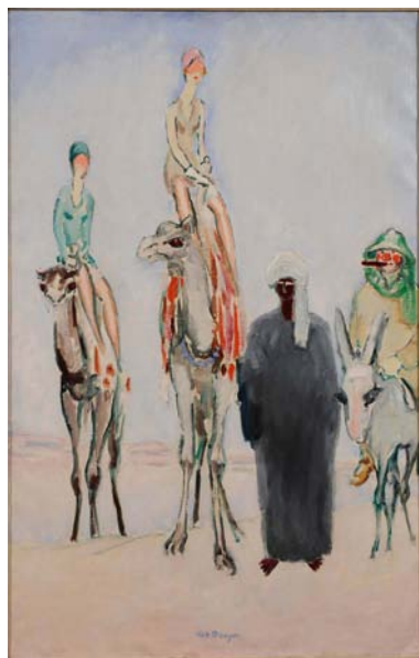
《ギザのピラミッドを訪ねて》100×65 cm