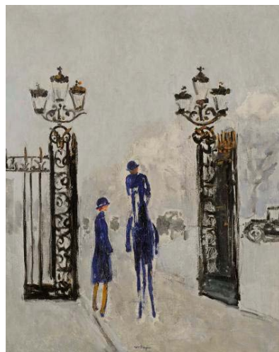
《ホルト・ドーフィヌ》100×81 cm

キース・ヴァン・ドンゲンは、1877年ロッテルダム近郊に生まれた類稀なる才能に満ちたオランダの画家です。20歳のとき初めてパリの地を踏み、以来美術の道を歩み、1900年初頭にはマティス、ヴラマンク達と共にフォーヴィズムを代表する画家として輝かしい功績を残します。その後フォーヴィズムの終焉と共に彼独自の世界を展開させ、シャガール、モディリアニ、藤田等が活躍したエコール・ド・パリ華やかなりし頃のフランス画壇を席卷し、近代美術を代表する画家としてその名を美術史に刻んでいきます。