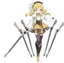
巴マミ (CV: 水橋かおり)