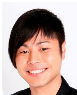
NON STYLE 井上裕介さん

株式会社 Fuji&gumi Games(本社:東京都新宿区、代表取締役社長:種田慶郎)は、同社が開発・運営を手掛けるスマートフォン向けゲームアプリ『ファントム オブ キル』(以下『ファンキル』)と、『劇場版 魔法少女まどか☆マギカ [前編] 始まりの物語/[後編] 永遠の物語』(以下『まどか☆マギカ』)とのスペシャルコラボレーションプロジェクトにおいて、『まどか☆マギカ』のファンとして知られる芸人 NON STYLE 井上裕介さんと、パンサー菅良太郎さんが出演するスペシャル動画を特設サイトにて公開いたしました。(公式スペシャルコンテンツサイト: http://madoka-pk.fg-games.co.jp/voice.html )