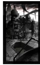
ワルブルギスの夜ステージ