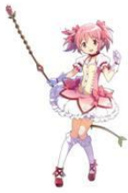
鹿目まどか (CV: 悠木碧)