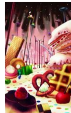
お菓子の魔女ステージ