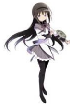
曉美ほむら (CV: 斎藤千和)