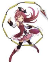
佐倉杏子 (CV: 野中藍)