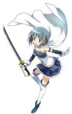
美樹さやか (CV: 喜多村英梨)