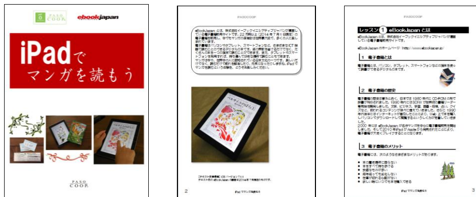
iPad でマンガを読もう（全 40 ページ）

全国のパソコン教室向けに教材提供はじめ各種ツールの開発・販売を行う一般社団法人パソコープ（本部：東京都中央区、代表者：柴田和枝（しばたかずえ）、以下パソコープ）と、マンガ No.1（※1）の電子書籍販売サイト「eBookJapan」を運営する、株式会社イーブックイニシアティブジャパン（本社：東京都千代田区、代表取締役社長：小出斉（こいでひとし）、以下 eBookJapan）は共同で、教材テキスト「iPad でマンガを読もう」を作成し、7月1日よりパソコン教室および一般向けに販売を開始しました。