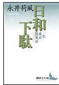
日和下駄 一名 東京散策記 永井荷風