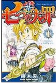
七つの大罪 鈴木央