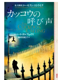
カッコウの呼び声 私立探偵コロン・ストライク ロバート・ガルブレイス 訳: 池田真紀子

eBookJapan では、今後も読者にいち早く作品を届けられるよう、積極的に電子化を進めてまいります。