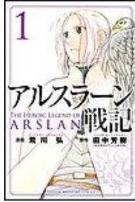
アルスラーン戦記 田中芳樹／荒川弘