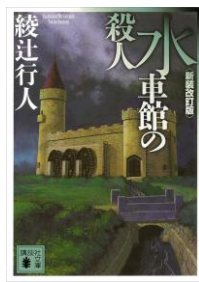
水車館の殺人 (新装改訂版) 綾辻行人