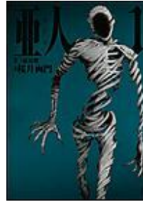
歪人 桜井画門／三浦追儼