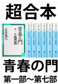
超合本 青春の門 第一部～第七部 五木寛之