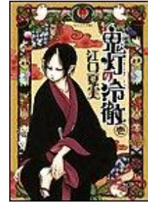
鬼灯の冷徹 江口夏実