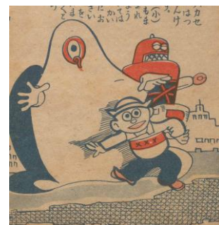
『スモール博士と怪人Q』より