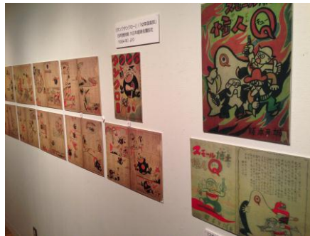
日本大学芸術学部芸術資料館では阪本牙城作品の複製原画と資料を7/25まで展示中。