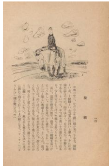
『復刻 鍬の兵隊』より