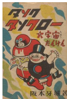
『復刻 タンクタンクロー 大宇宙たんけん』より