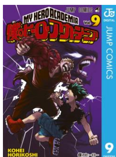
『僕のヒーローアカデミア』 堀越耕平

eBookJapan と集英社公式電子書店「ジャンプ BOOK ストア!」限定で、現在アニメも絶賛放送中の『僕のヒーローアカデミア』や連載10周年を迎えた『嘘喰い』など、人気作の最新刊を1週間のみ「著者のサイン」が入った特別版で販売いたします。