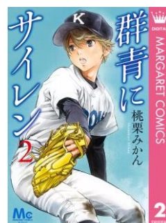
『群青にサイレン』 桃栗みかん

・「新刊サイン本」販売タイトルおよび対象期間（下記の期間を過ぎますと、通常版の販売となります）