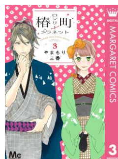
『椿町ロンリープラネット』 やまもり三香