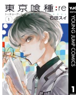
『東京喰種 トーキョーグール:re』