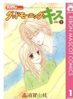
『グッドモーニング・キス』