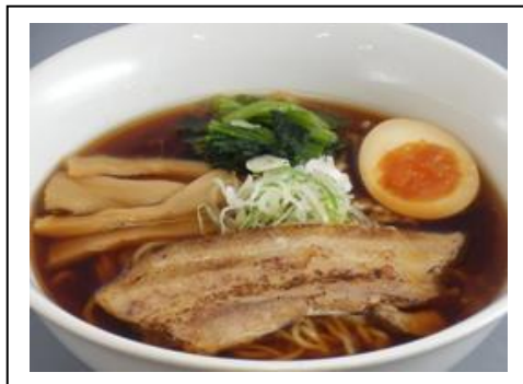
炙り麦豚ラーメン(税込 700 円) 上信越自動車道 横川ISA(下り線)