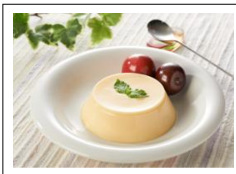
黄金桃プリン(税込 1,296 円) 北陸自動車道 黒埼PA(上り線)