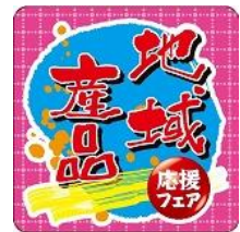
〈地域産品応援シール〉

なお、専用用紙は、各SA・PAにて入手、または当社ホームページ「ドラぶら」からダウンロードすることができます。