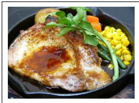
上州麦豚ポークソテー(税込 1,500 円) 関越自動車道 赤城高原SA(上り線)