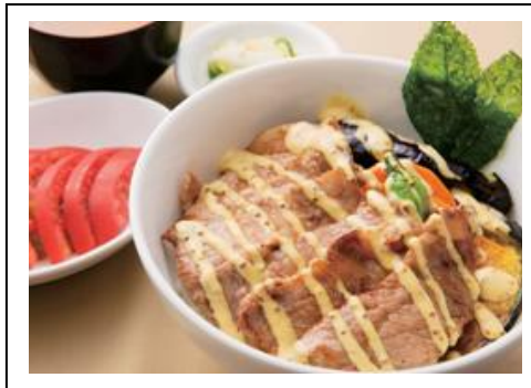
那須豚の焼肉どん(税込 900 円) 東北自動車道 那須高原SA(上り線)