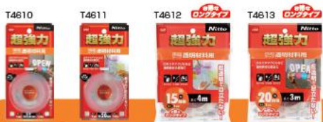
超強力両面テープ 透明材料用 ガラスやアクリルなどの透明素材の固定や補修に金属や木材などにも使えます