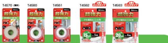
超強力両面テープ 塩化ビニル用 つきにくかった塩化ビニル素材の接着や補修に金属や木材などにも使えます