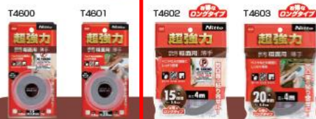
超強力両面テープ 粗面用薄手 凹凸面やザラザラ面への接着や補修に最適。ベニヤやブロックなどの粗面への接着に