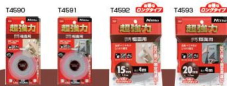
超強力両面テープ 粗面用 凹凸面やザラザラ面への固定用途に合板やモルタル、ブロックなどの粗面への固定用途に