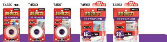
超強力両面テープ プラスチック用 つきにくかったポリプロピレン・ポリエチレン素材の接着や補修に金属や木材などにも使えます