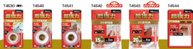
超強力両面テープ 多用途 金属・プラスチック・塩化ビニル、タイル、木材など幅広い素材の固定や補修に

機能を追求したHG（ハイグレード）シリーズと値頃感を追求したBS（ベストセレクト）シリーズを統合し、2アイテムを新しく追加。幅・長さ・シーンに合わせて選べるラインナップです。