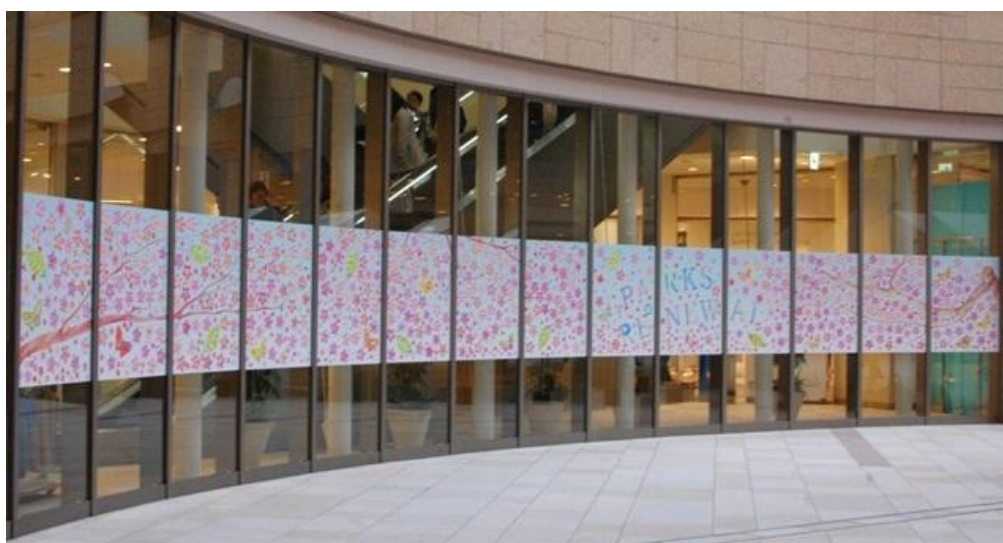
完成したウォールアート（縦 1.2m×横 14m）

作品は、なんばパークス 2階 キャニオンコートにて 3月27日（金）～4月12日（日）まで展示されます。