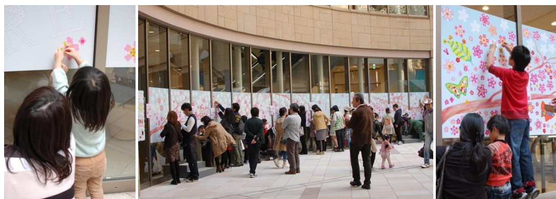
制作風景（線画に、シールを貼り合せ桜の花びらや蝶を制作します。）