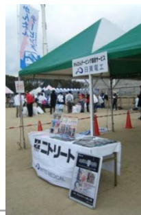
テーピングサービスの模様 (2012年大会)

このテーピングサービスは、日東電エグループの社員ボランティアによって実施され、会場の清掃・ハーフマラソン出走者への給水などにも、社員および、そのご家族のボランティアが参加し、ニトムズからも4名の社員がボランティア活動に取り組みます。