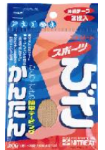
かんたん テーピング