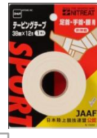
テーピング テープ