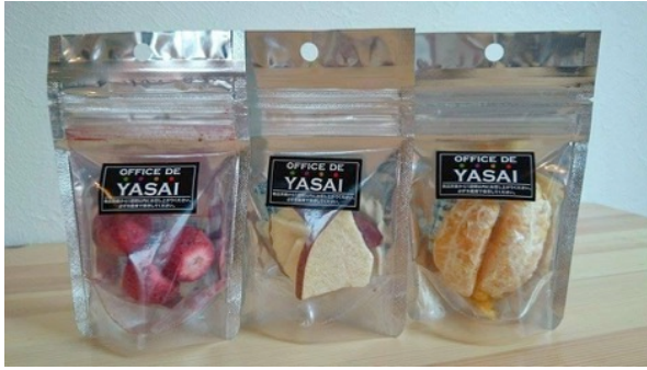
OFFICE DE YASAI 向けに共同開発した ドライフルーツ(釧路・ふたみ青果)