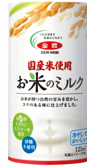
お米の栄養が手軽にまるごと補給できる 「全農 国産米使用 お米のミルク」