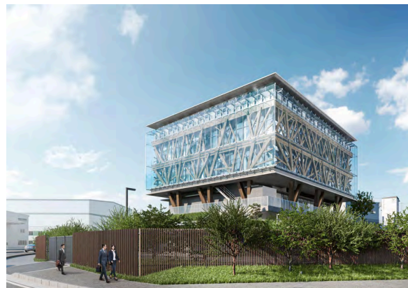
図1 大成建設グループ次世代技術研究所イメージ 左：次世代技術研究所 全景／右：研究管理棟 外観