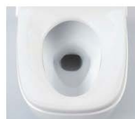
ワイドスクエア便座

※プラズマクラスターロゴ及びプラズマクラスター、Plasmaclusterは、シャープ株式会社の商標です。