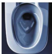
アクアセラミック