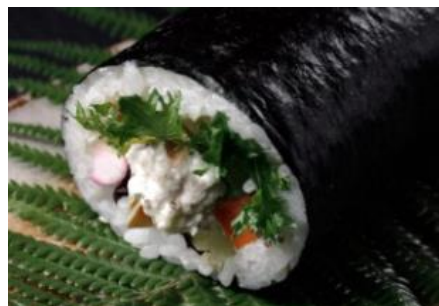
近江自然薯サラダ巻