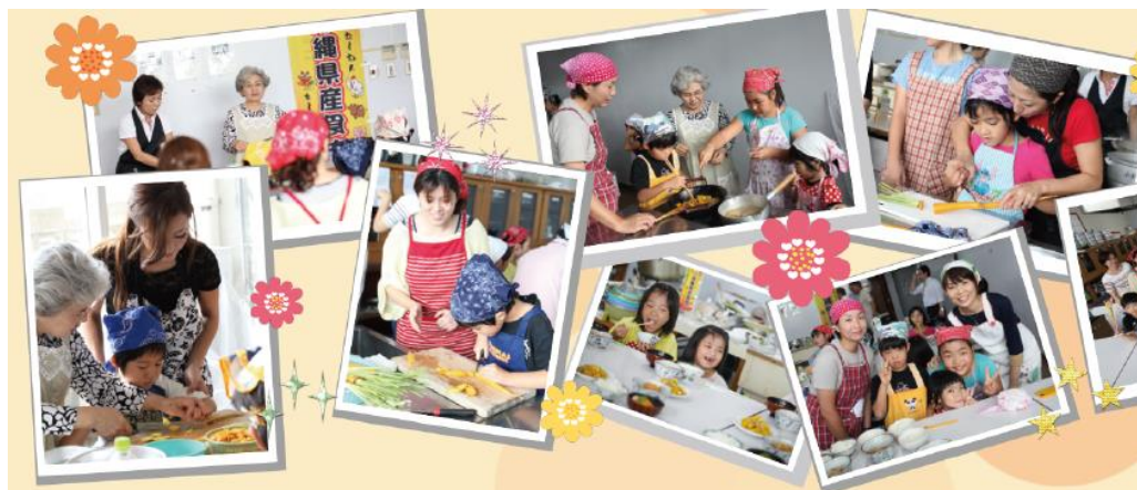
第一回「料理教室」の様子