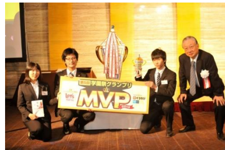
▲昨年の第5回学園祭グランプリ表彰式