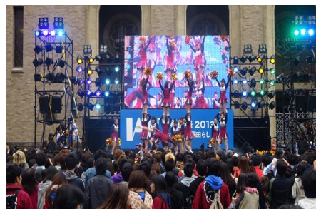
▲大学学園祭の様子