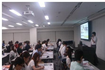
▲キックオフ説明会の様子

MVP受賞校には、東京藝術大学教授・日比野克彦先生による世界に一つのオリジナルトロフィーを贈呈されます。入賞校には協賛企業より提供の豪華副賞（三井住友カードVJAギフトカードを含む）が贈られる予定です。