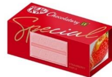
「キットカット ショコラトリー スペシャル ストロベリーメープル」

素材の味を活かしたいちごをホワイトチョコレートに練り込み、 爽やかな酸味とストロベリーの味わいを表現しました。 ほのかに香るメープルとの絶妙なハーモニーをお楽しみいただけます。