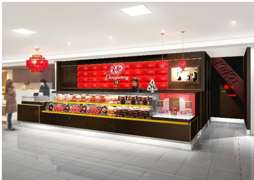
「キットカット ショコラトリー 大丸福岡天神店」ショップイメージ