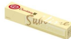
「キットカット サプリム ホワイト」