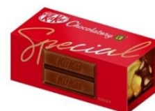
「キットカット ショコラトリー スペシャル ジンジャー」

ジンジャーエキスパウダーを練り込んだクリームにウェハースを重ね、ミルクチョコレートで包み込みました。口の中にジンジャーの香りが広がり、まろやかな甘みと上品な辛みがしっかり感じられます。