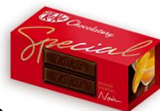
「キットカット ショコラトリー スペシャル オレンジカクテル ノワール」

オレンジの香りが漂うチョコレートとウェハースの層間に練りこんだラム酒パウダーで、 「キットカット」がオレンジカクテルになりました。