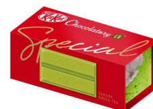
「キットカット ショコラトリー スペシャル サクラグリーンティ」

抹茶ペーストを練り込んだホワイトチョコレートと、サクサクのウェハースの層間のクリームに練り込んだ桜葉エキスパウダーが、日本の風流を感じさせる華やかな味わいです。宇治茶葉を使用し、さらに本格的な味わいになりました。