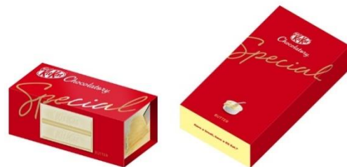
「キットカット ショコラトリー スペシャル バター」 (左:4 枚入り／右:12 枚入り)

ウェハースの層間にバターパウダーを練り込み、 チョコレートの甘さを活かしながらしっかりとバターのコクを感じられる 味わいに仕上げました。