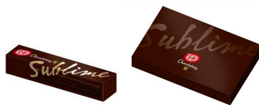
「キットカット サプリム ビター」 (左:1 本/右:10 本入りギフトボックス)

「キットカット ショコラトリー」の基幹商品。パティシエやショコラティエが使用するカカオ分 66%のクーベルチュール ビターチョコレートを、ウェハース層間と表面のコーティングにふんだんに使いました。上品な口どけとビターテイストが味わえます。