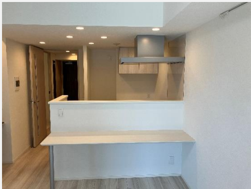
▲ カウンターでのお食事も