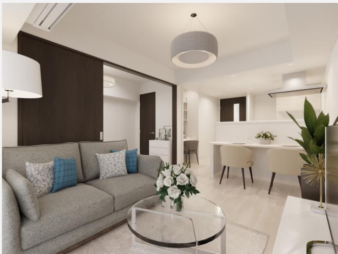
▲ Aタイプ（1LDK：41.77㎡）室内イメージ *