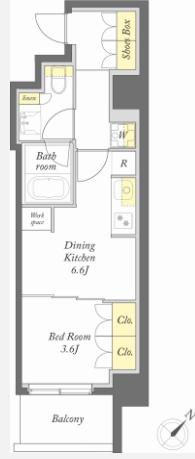
【Eタイプ】1DK : 32.08㎡