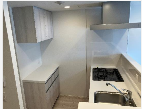
▲ 備え付けの食器棚