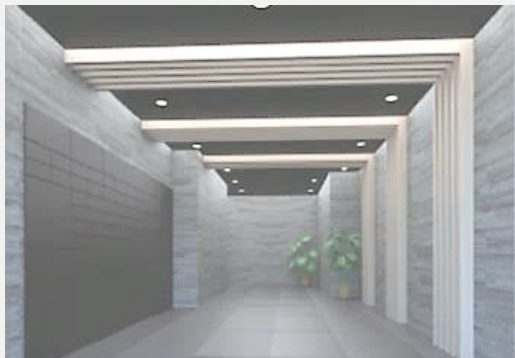
▲ エントランスホール *