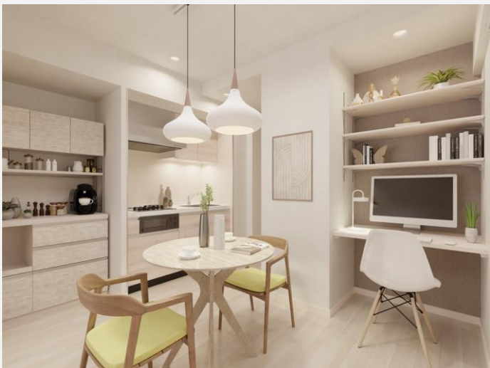
▲ 全タイプに住戸内ワークデスクを完備 *