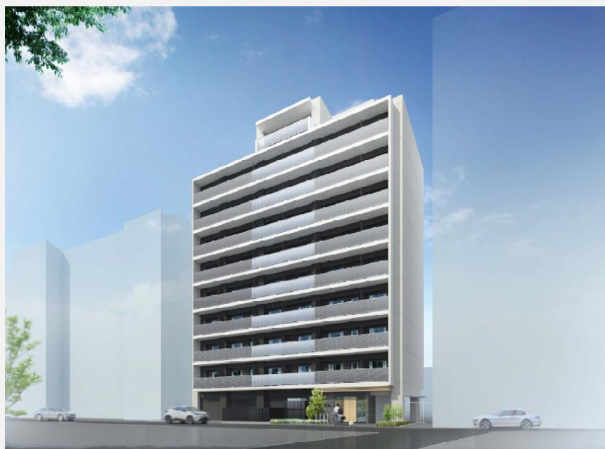
▲ 外観 *