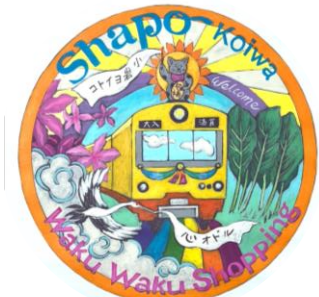
千葉側地下街角アート- 招き猫-