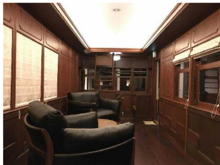
&lt;客室 耶馬溪の杜「せきれい」&gt;

車両を格納する建物は駅舎をイメージしており、プラットフォームに見立てた廊下に沿って車両が停車するように客室として配置しています。客室である車両の内装は、地域を代表する景勝地「青の洞門」「国東半島」「耶馬溪」をテーマにデザインされた、旧耶馬溪・国東鉄道遺産の世界観を楽しめる空間です。非日常空間を楽しみつつゆっくりとくつろげる室内をめざし、大分県特産国東の七島蘭の畳や日田の小鹿田焼で設えた洗面台など、地域の伝統を活かしたインテリアとなっています。