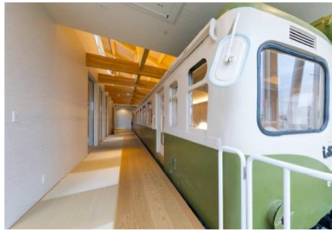
&lt;プラットフォームに見立てた廊下&gt;