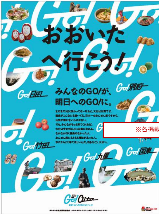
6月17日掲載広告ビジュアル

毎日、各地の観光名所の写真と心に響くキャッチコピー。今年5月に「今の別府にとってお客様は(マジで)神様です。」というキャッチコピーが話題を呼んだGO!Beppu キャンペーンに続き、今回は自治体単独ではなく、連合のインパクトでおおいたの魅力を強力に訴求します。