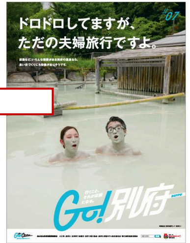
6月24日掲載(別府市)広告ビジュアル