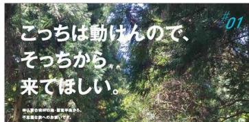
6月18日掲載(国東市)広告ビジュアル