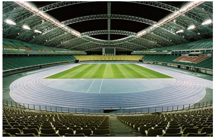
ワールドカップ2019大会会場となる大分スポーツ公園総合競技場

試合前（10:30～）には、ダイビングトライやラインアウトが体験できる「ラグビー体験コーナー」や、ラグビーワールドカップ2015大会ベスト8国の名物料理を提供する「フードコート」のほか、ラグビーグッズ販売コーナーなど、ラグビーワールドカップ2019の大会本番の雰囲気を楽しめるコーナーを設け、ラグビーファンや観光客も楽しんで頂ける様々な催しを企画しています。