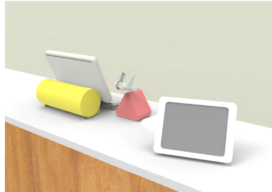
タブレットPOS お客様側イメージ