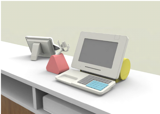
タブレットPOS 店員側イメージ