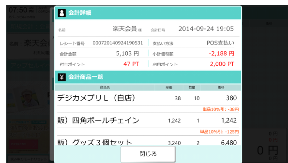
タブレットPOS「楽天ポイント会計画面」イメージ