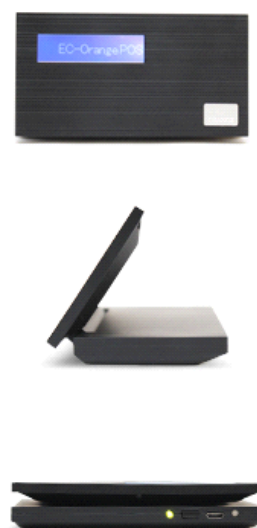
「タブレットPOSなどと連動可能」カスタマーディスプレイ イメージ