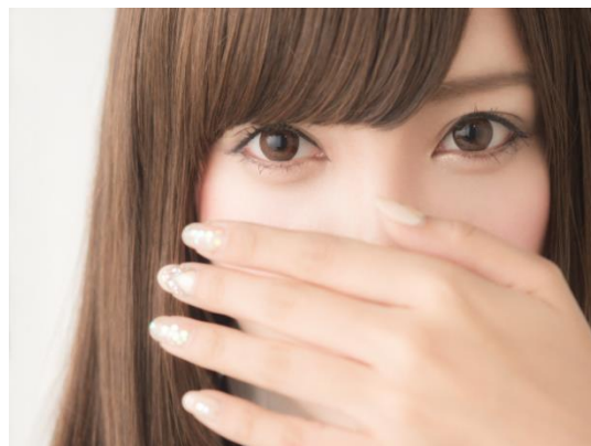
【白石麻衣さん風ものまねメイク】