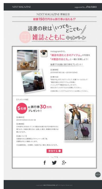
【キャンペーンサイトTOP】

■当選について： 当選者の方には事務局よりキャンペーン終了後2週間以内にご連絡いた します。