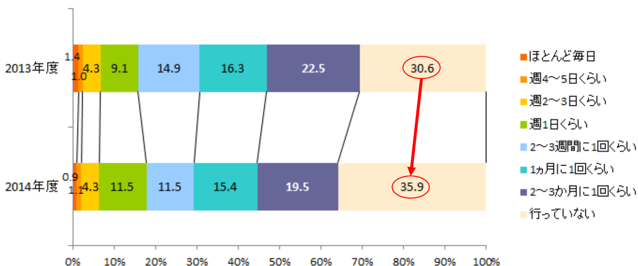
[図 1] 最近3ヵ月間の外飲み頻度 前年度比較