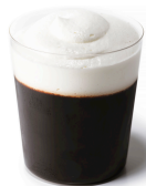
【コーヒーゼリー】 ¥350 (税込)

コロンビア産深煎り豆を使ってなめらかな口どけと深く、豊かな香りのジュレに仕上げました。コクのある生クリームとの相性がベストバランスです。