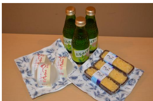
会場で振る舞われた試食をしたお礼品

税の使い方や地域活性化について自ら能動的に考え、行動に移す今注目の「納活(のうかつ)」を元に、家庭との両立をしながらなど様々なバックグラウンドや志向を持つ働く女性がふるさと納税や地域の創生や活性化について学ぶ大人の部活動です。活動内容および今後の予定については順次、日本橋女子納活部公式 facebook ページ ( https://www.facebook.com/noukatsujyoshi ) で更新されています。参加応募は、専用応募フォーム ( https://ssl.form-mailer.jp/fms/472cf999390815 ) で受け付けています。