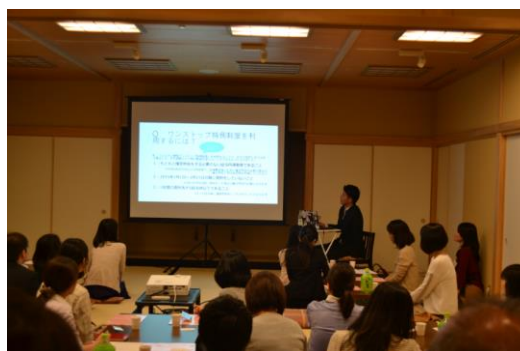
熱心に聞き入る参加者たちの様子

仕事や家事にと毎日エネルギーに過ごす女性たちが、「ふるさと納税」を通して、馴染みがなかった地域やこれまで知らなかった故郷の魅力を発掘していくとともに、自分たちができる地域活性化や税の使い方や能動的に考える「納活」を実践していきます。