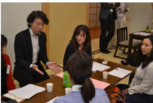
税理士の方に質問するワークショップの様子