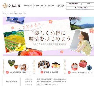
「さとふる」納活ページ