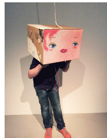
(左) VRコンテンツ画像