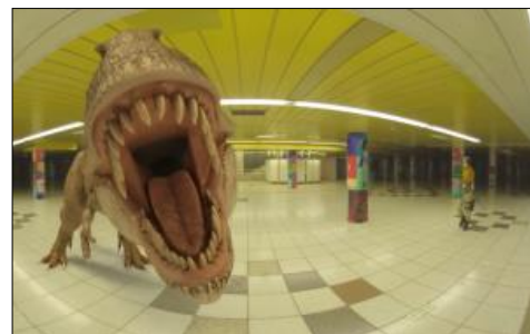
【『Risky Spot(リスクスポット)』体験イメージ】