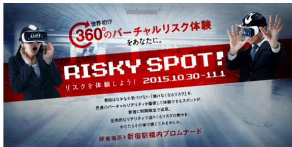
【『Risky Spot(リスクスポット)』イメージ】

～ 最新鋭ヘッドマウントディスプレイを使用し、様々なリスクが次から次へと襲い掛かってくる迫力満点のバーチャルリアリティ映像を体験いただけます!! ～